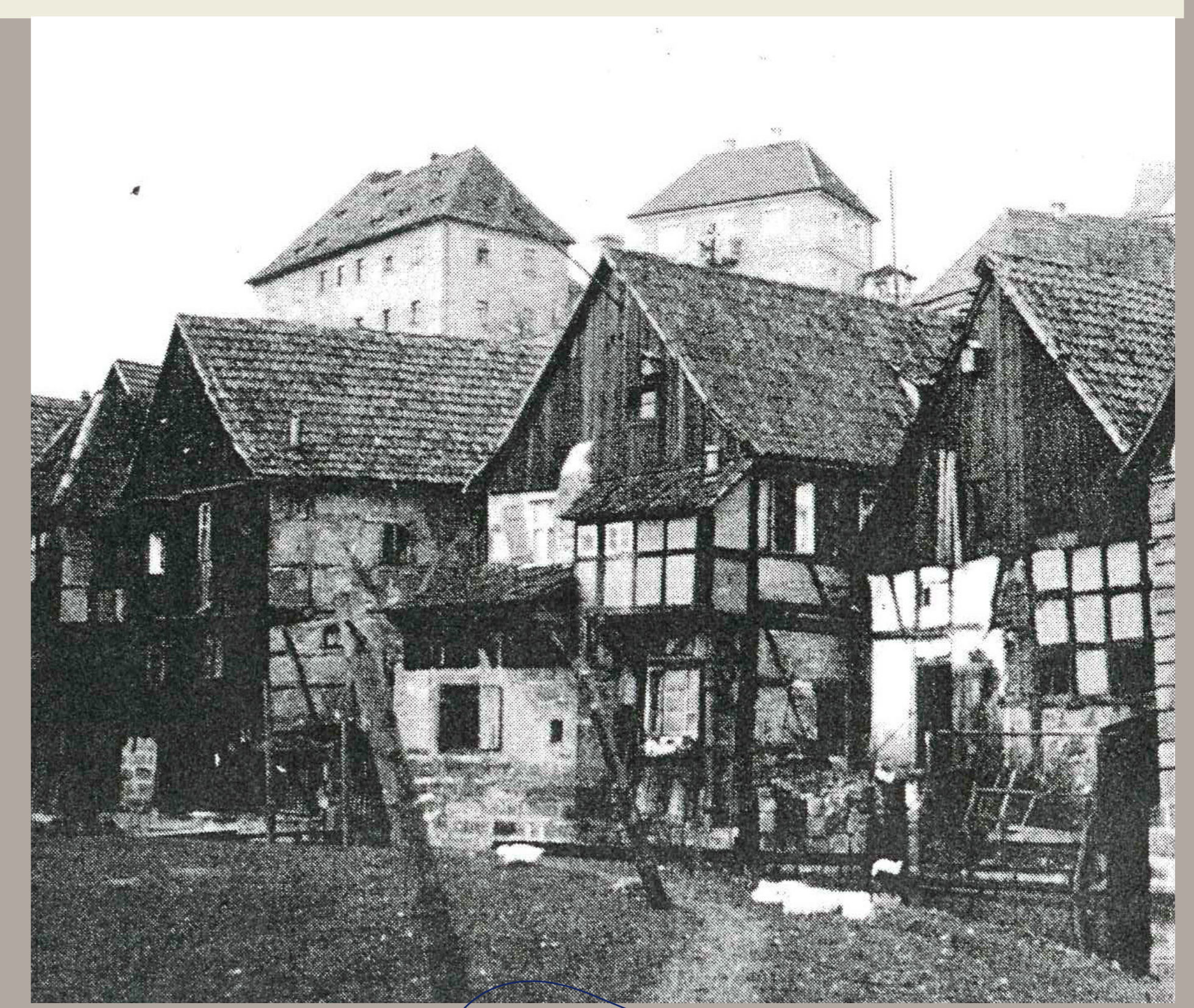
Die „Bayer-Häuser“, heute Kulmbacher Straße 22. Links Vorderfront, rechts Rückseite.

In den beiden „Bayer-Häusern“ gab es kleine und enge Zimmer, die nicht überall einen großen Lichteinfall hatten. Hier lebten 11 Männer und Frauen sowie ein kleiner Junge beengt zusammen.