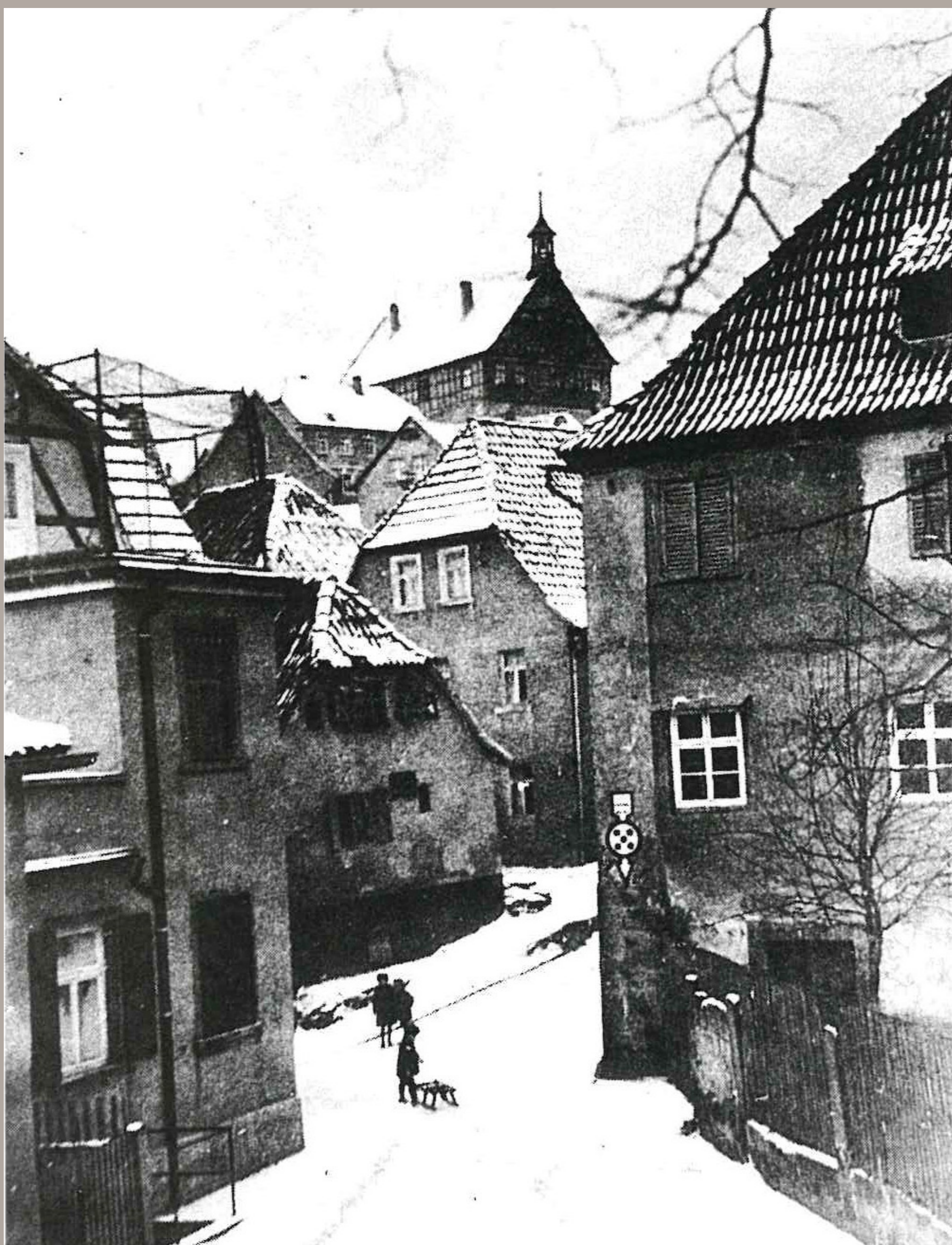
Rechts die jüdische Schule im Feuerweg 19