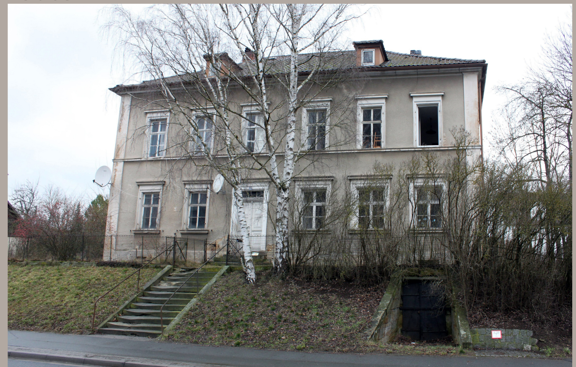
Das „Judenhaus“ in Hochstadt. Abdruck mit freundlicher Erlaubnis des „Fränkischen Tages“. Fotografin Ramona Popp

Frieda war die letzte der Familie Reuter, die in dem stattlichen Haus der Familie in Hochstadt lebte.